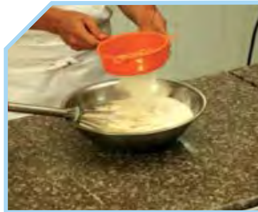
CHO BỘT MỠ VÀO