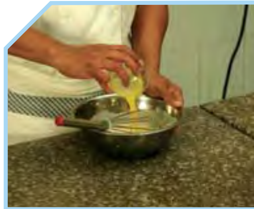
CHO BƠ CHẢY VÀO