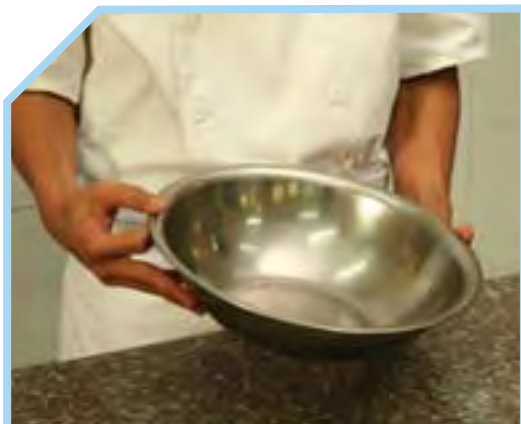
LỰA CHỌN ÂU TRỘN PHÙ HỢP