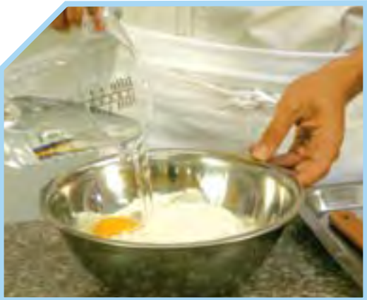
TRỘN CÁC NGUYÊN LIỆU