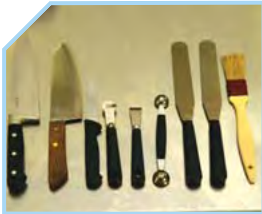
BÀN XẼNG, CHỖI VÀ DAO