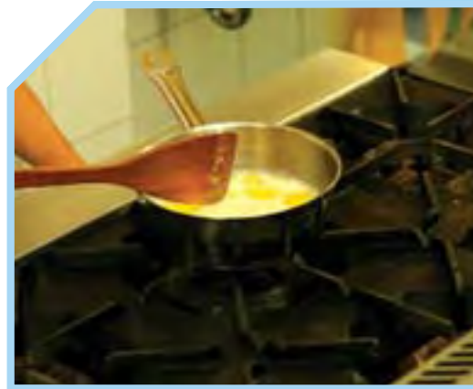
ĐUN SÔI HỖN HỢP ĐÃ TRỘN