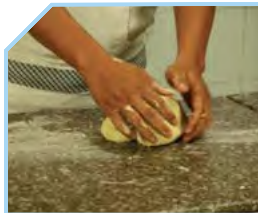
DÙNG CÁC ĐẦU NGÓN TAY TRỘN ĐỀU CÁC NGUYÊN LIỆU VỚI NHAU