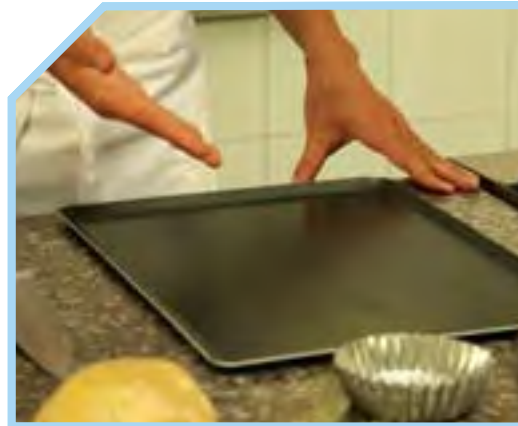
CHUẨN BỊ KHAY NƯỚNG BÁNH