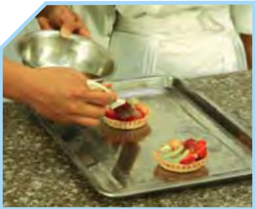
NƯỚC MEN LÀM BÓNG