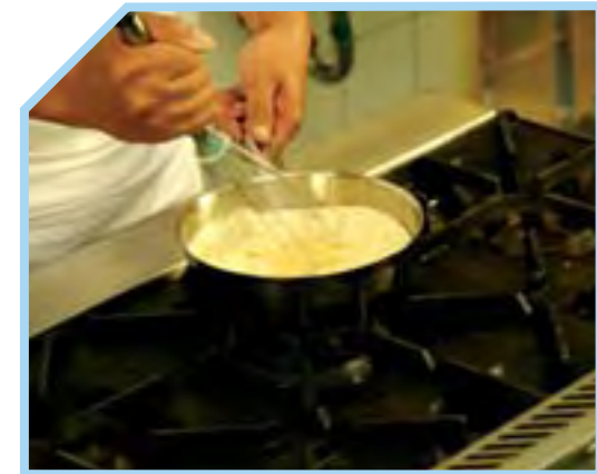
ĐUN SÔI HỖN HỢP