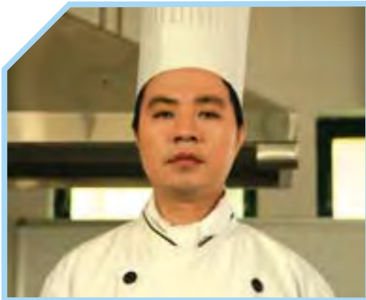
VỆ SINH CÁ NHÂN