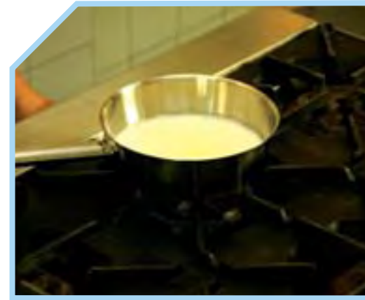
ĐUN SÔI SỮA