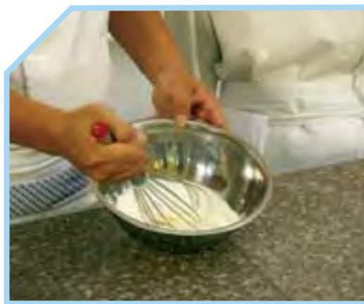
ĐÁNH KEM TƯƠI