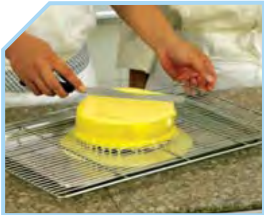
DÙNG BÀN XẼNG DÀN ĐỀU NƯỚC MEN GLAZE