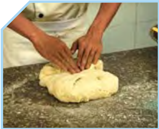
KÉO CĂNG BỘT NHÀO VÀ GẬP LÂM BA