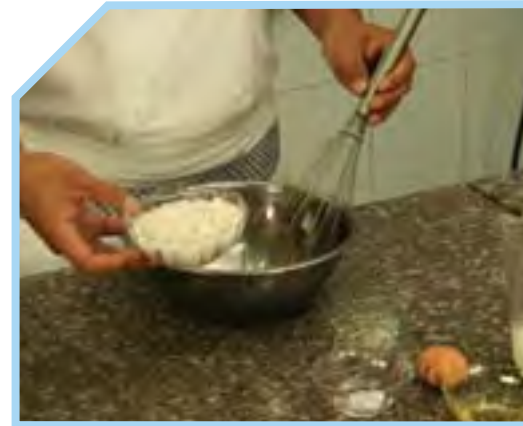
TRỘN CÁC NGUYÊN LIỆU