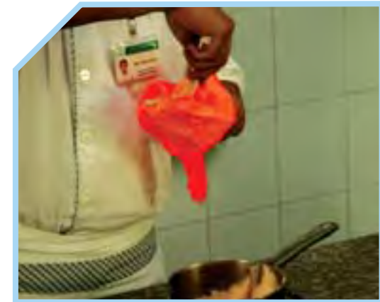
CHO HỖN HỢP VÀO TÚI BƠM