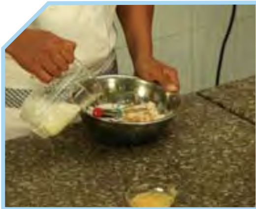
CHO THÊM DẦU ĂN VÀ SỮA