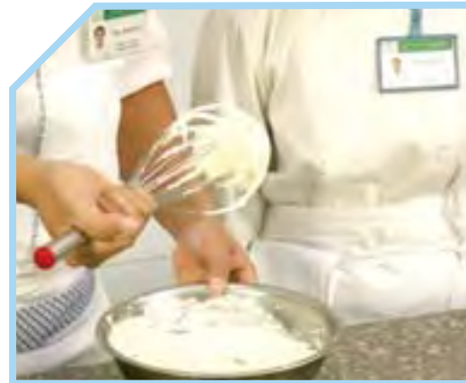
ĐÁNH CHO TỐI KHI HỖN HỢP ĐÚNG VÀ GIỮ NGUYÊN TRẠNG THÁI