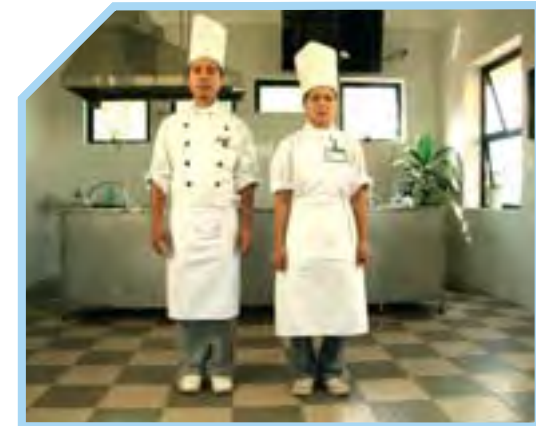
ĐỒNG PHỤC LUÔN SẠCH SẼ