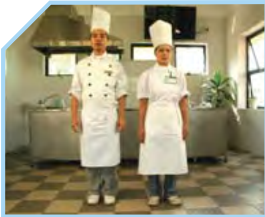
CHUẨN BỊ NHẬN CA