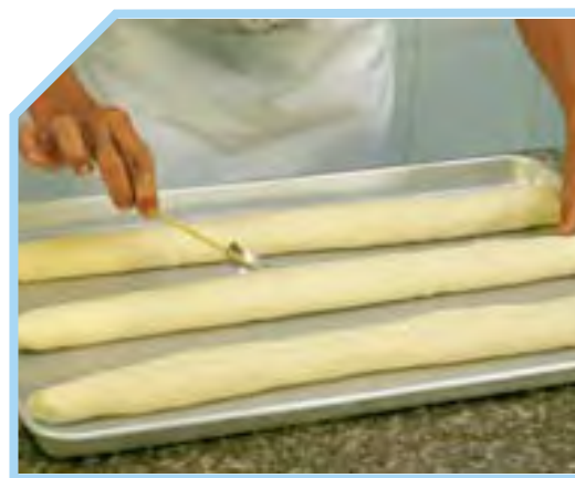
RẠCH BỘT NHÃO