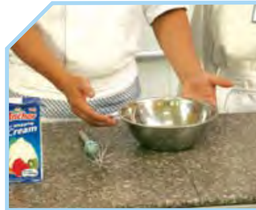
ÂU TRỘN KHÔ RÁO