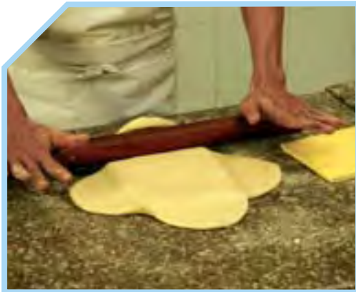
CHUẨN BỊ VÀ BỌC BƠ