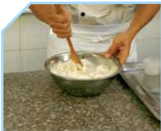
TRỘN CÁC NGUYÊN LIỆU