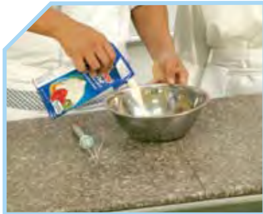
ĐỔ CHẤT LỎNG CẦN ĐÁNH