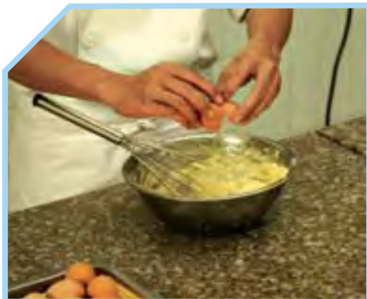
CHO THÊM TRỨNG