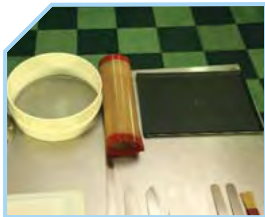
KHAY NƯỚNG BÁNH