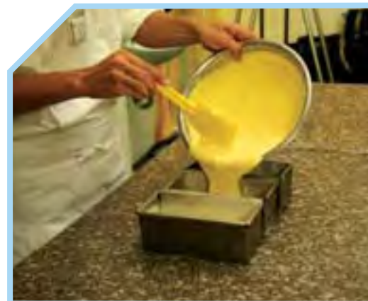
CHO HỖN HỢP VÀO TRONG KHUÔN