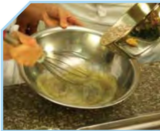
ĐÁNH LÒNG TRẮNG TRỨNG (LÀM MERINGUE)