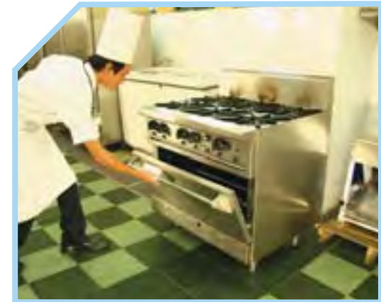
DÂY NHIỀU BẾP ĐƠN HOẶC MẶT BẾP PHẪNG LỚN