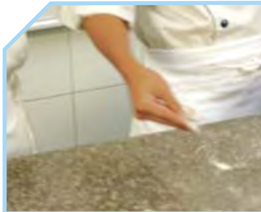
XOA XOA BỘT KHÔ LÊN MẶT BÀN