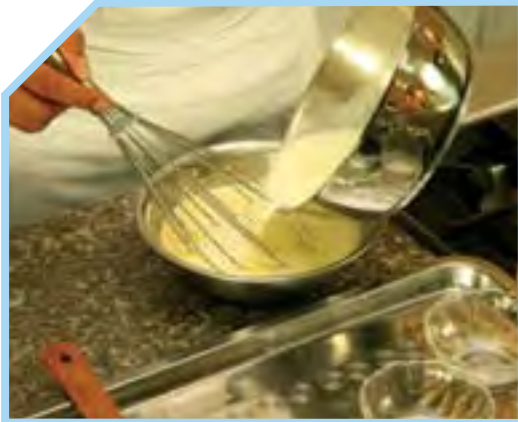
ĐỔ SỮA ĐÃ SÔI VÀO TRONG HỖN HỢP