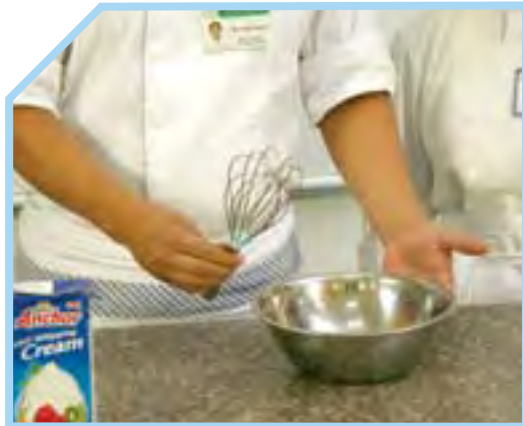
CHUẨN BỊ DỤNG CỤ