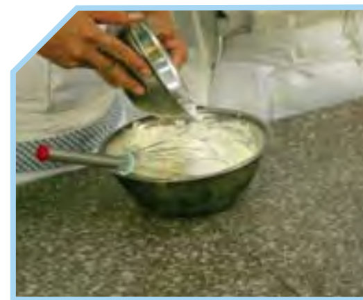
CHO THÊM ĐƯỜNG HOÁN