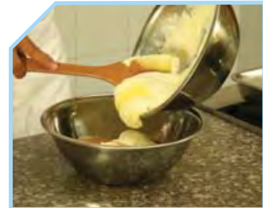
TRỘN KEM VỚI HỖN HỢP ĐÃ ĐÁNH