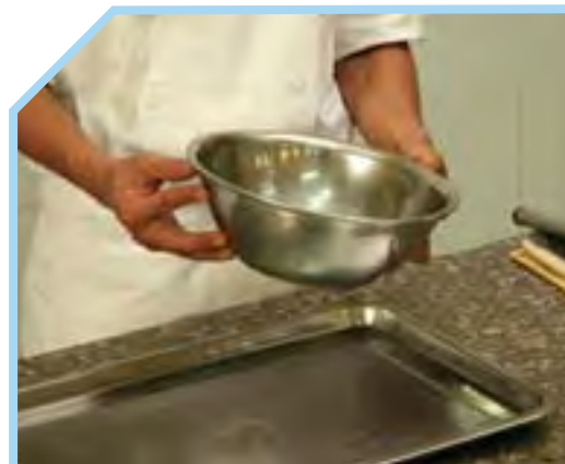
ĐẢM BẢO RẰNG ÂU TRỘN KHÔ VÀ SẠCH SẼ