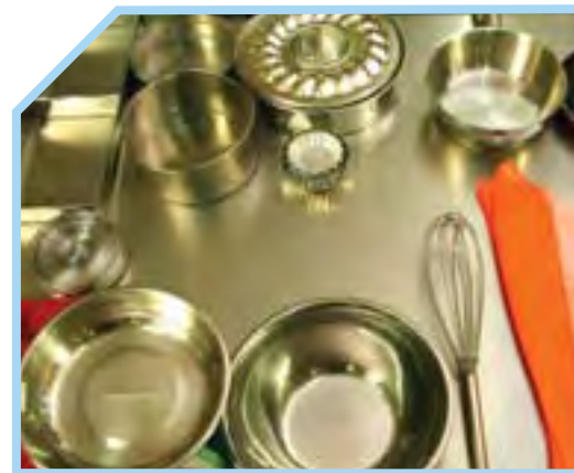
BÁT TRỘN VÀ NHỮNG DỤNG CỤ LÀM BÁNH KHÁC