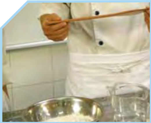
CHUẨN BỊ DỤNG CỤ