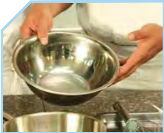
ÂU TRỘN PHẢI SẠCH SẼ