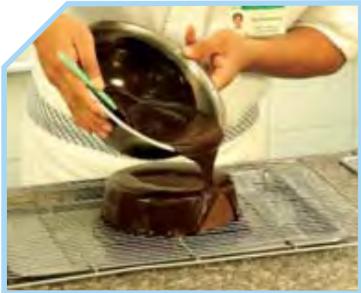
NƯỚC MEN LÀM BÓNG