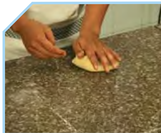
DÙNG CÁC ĐẦU NGÓN TAY TRỘN ĐỀU CÁC NGUYÊN LIỆU VỚI NHAU