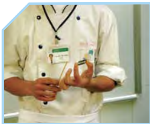
CHUẨN BỊ DỤNG CỤ