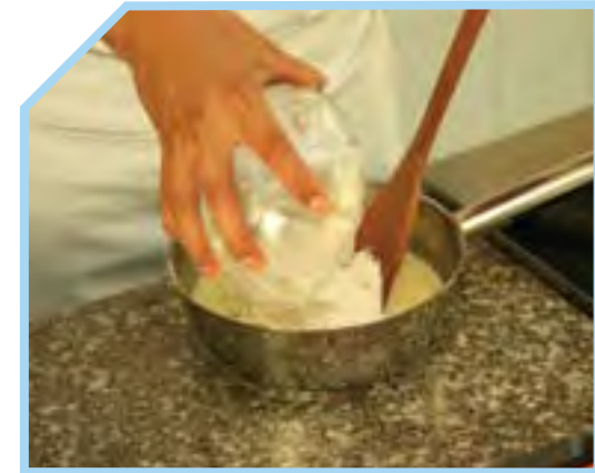
CHO BỘT MỠ VÀO