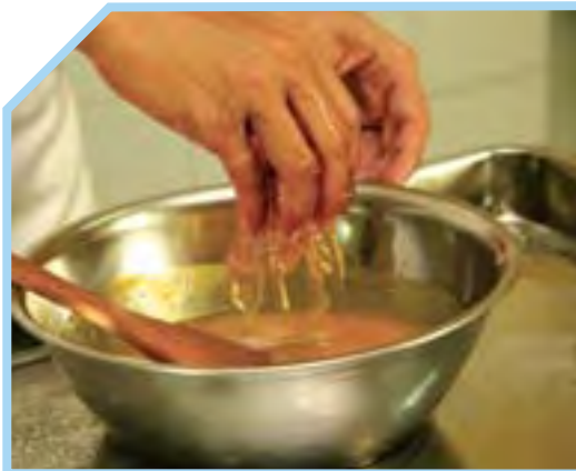
CHO GELATINE VÀO