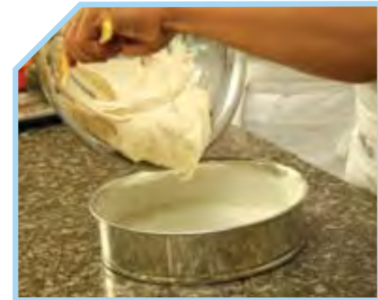
CHO HỖN HỢP VÀO TRONG KHUÔN