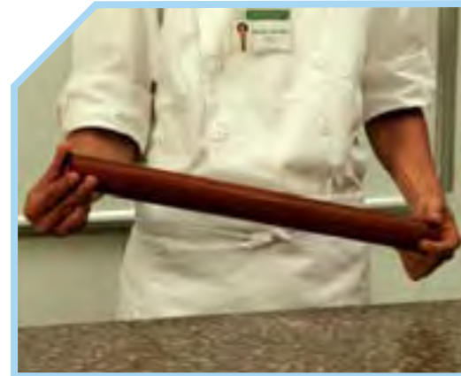
LỰA CHỌN CÁI CÁN BỘT PHÙ HỢP