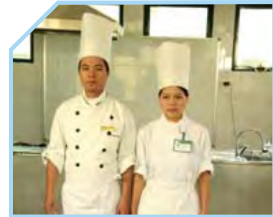
ĐỒNG PHỤC ĐỐI VỚI NHÂN VIÊN NAM VÀ NỮ