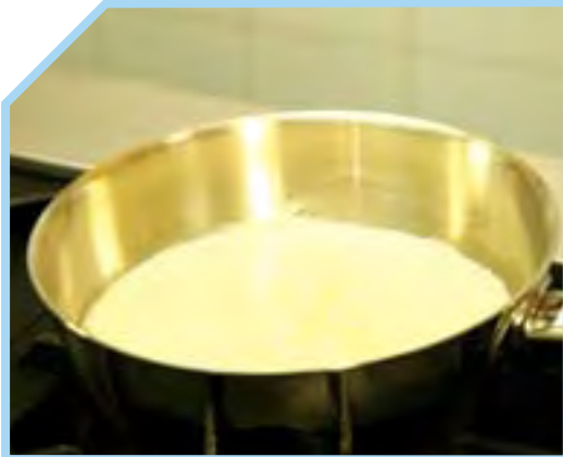
ĐUN SÔI SỮA