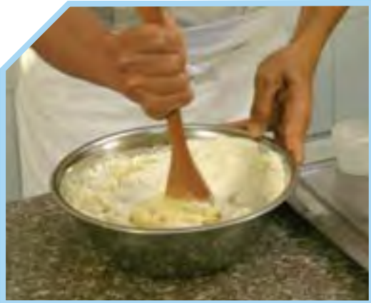
TRỘN ĐỀU VỚI NHAU