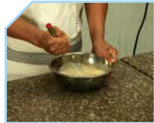
DÙNG PHỔI ĐÁNH NHẸ