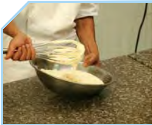
ĐÁNH HỖN HỢP TRỨNG VÀ ĐƯỜNG