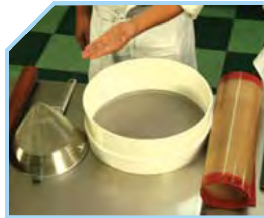
RÂY BỘT, PHỄU LỌC