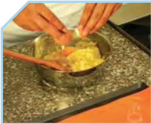
CHO TRỨNG VÀO