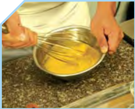
TRỘN LÒNG ĐỎ TRỨNG VỚI ĐƯỜNG