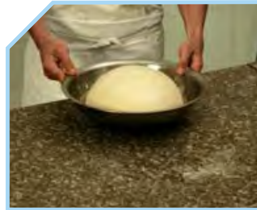
Ủ LÊN MEN LẦN THỨ NHẤT/ BỘT NGHỈ