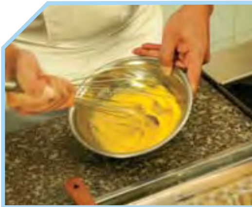
TRỘN LÒNG ĐỎ TRỨNG VỚI ĐƯỜNG VÀ BỘT MỠ