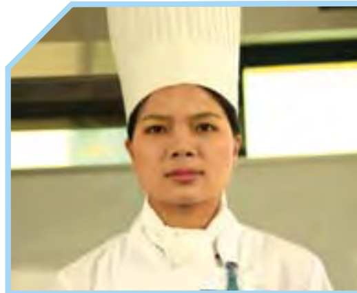
VỆ SINH CÁ NHÂN