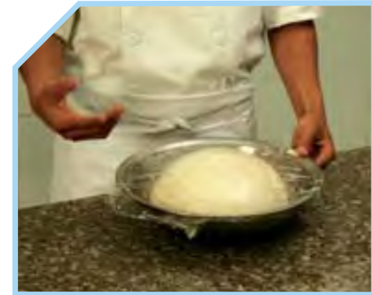
Ủ LÊN MEN LẦN THỨ NHẤT/ BỘT NGHỈ