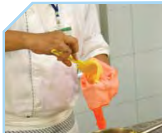
CHO HỖN HỢP VÀO TÚI BƠM