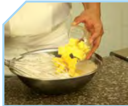
CHO THÊM BƠ