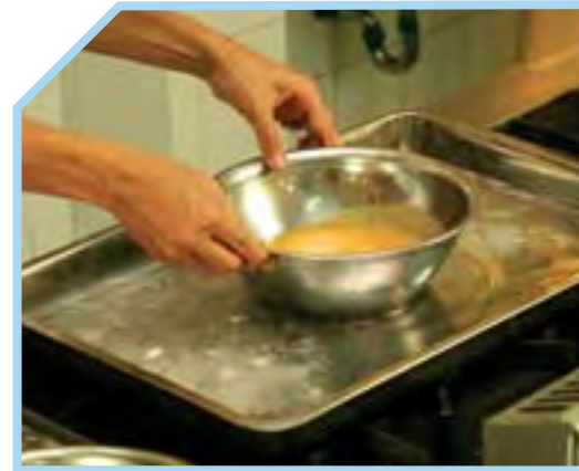
ĐẶT ÂU VÀO TRONG THIẾT BỊ ĐUN CÁCH THỦY