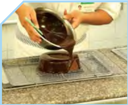
NƯỚC MEN GANACHE