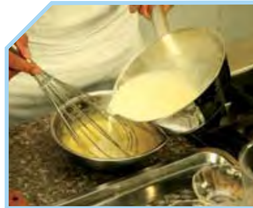
CHO THÊM SỮA ĐÃ ĐUN SÔI VÀO HỖN HỢP