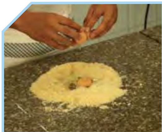
CHO THÊM TRỨNG