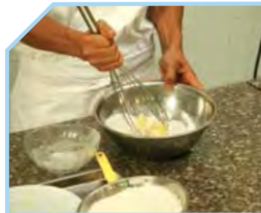
ĐÁNH HỖN HỢP BƠ VÀ ĐƯỜNG